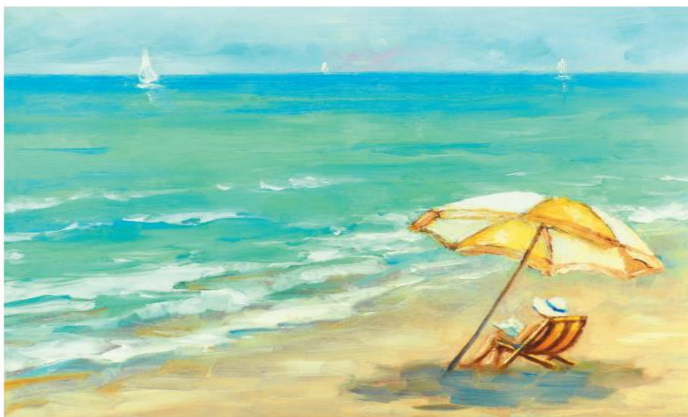
Oleg Sumarokov Kobieta pod parasolem odpoczywająca na plaży

Olega Sumarokova Kobieta pod parasolem odpoczywająca na plaży.